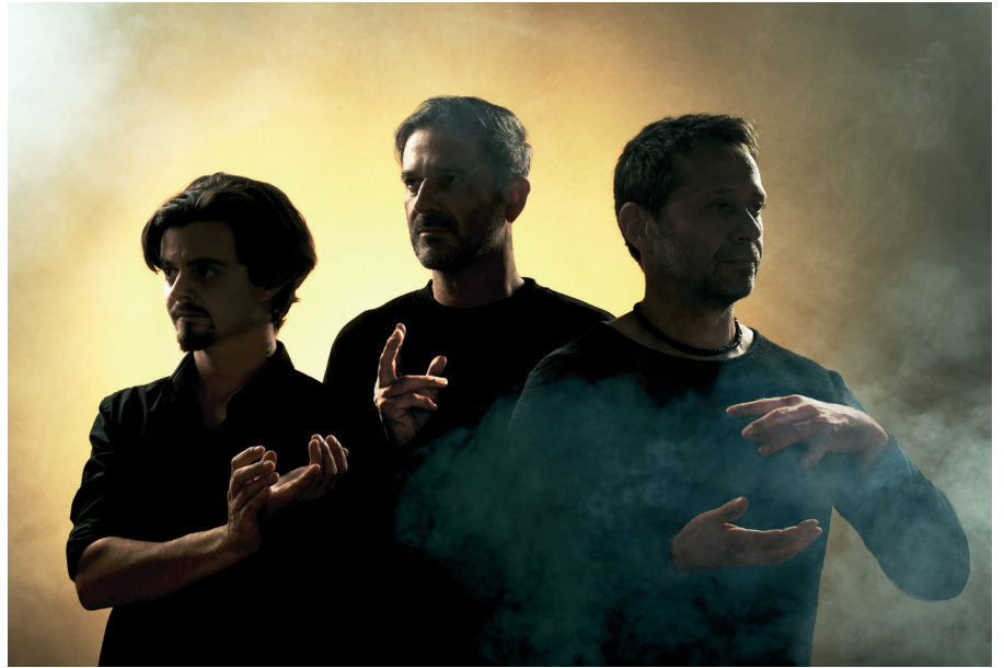
© Stefan Clay, Maria Teresa Federico & Charles Niklaus

Stefan Clay +41 79 755 19 72 jacuzzi.jaguar@plus-plus.ch