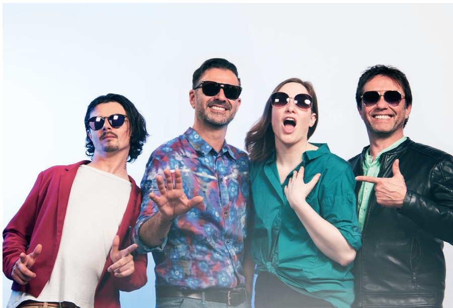
© Stefan Clay, Maria Teresa Federico & Charles Niklaus

Stefan Clay +41 79 755 19 72 jacuzzi.jaguar@plus-plus.ch